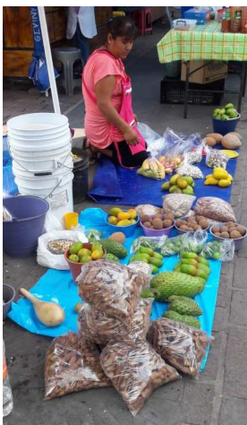
Imagen 2. Puesto de frutos en el mercado de Malinalco