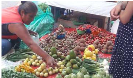
Imagen 1. Puesto de frutos en el mercado de Malinalco

En la comunidad de San Nicolás, el 91% de las especies arbóreas distribuidas en el tianguis se utilizan en la alimentación. El resto es usado en la medicina tradicional, por ejemplo el Ayoyote, codo fraile [ Thevetia thevetioides (H.B.K.) Schum.], o en aspectos mágico-religiosos, como el colorín ( Erythrina coralloides DC.).